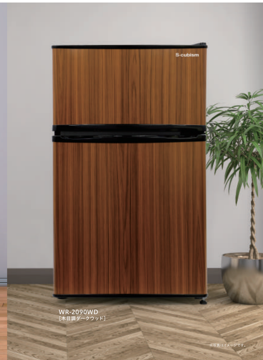
WR-2090WD 【木目調ダークウッド】