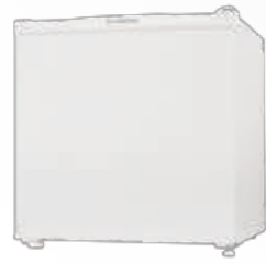
WR-1046(ホワイト) 4562434 296122