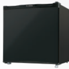
WR-1046BK(ブラック) 4562434 296245