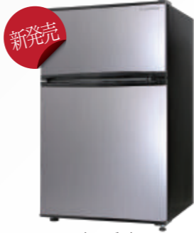
WR-2090SL(シルバー) 4562434 296382