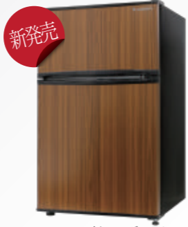
WR-2090WD(木目調ダークウッド) 4562434 296375