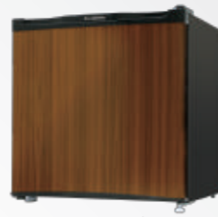
WR-1046WD(木目調ダークウッド) 4562434 296252