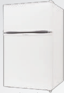
WR-2090(ホワイト) 4562434 296139