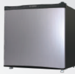
WR-1046SL(シルバー) 4562434 296283