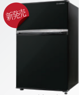
WR-2090BK(ブラック) 4562434 296368